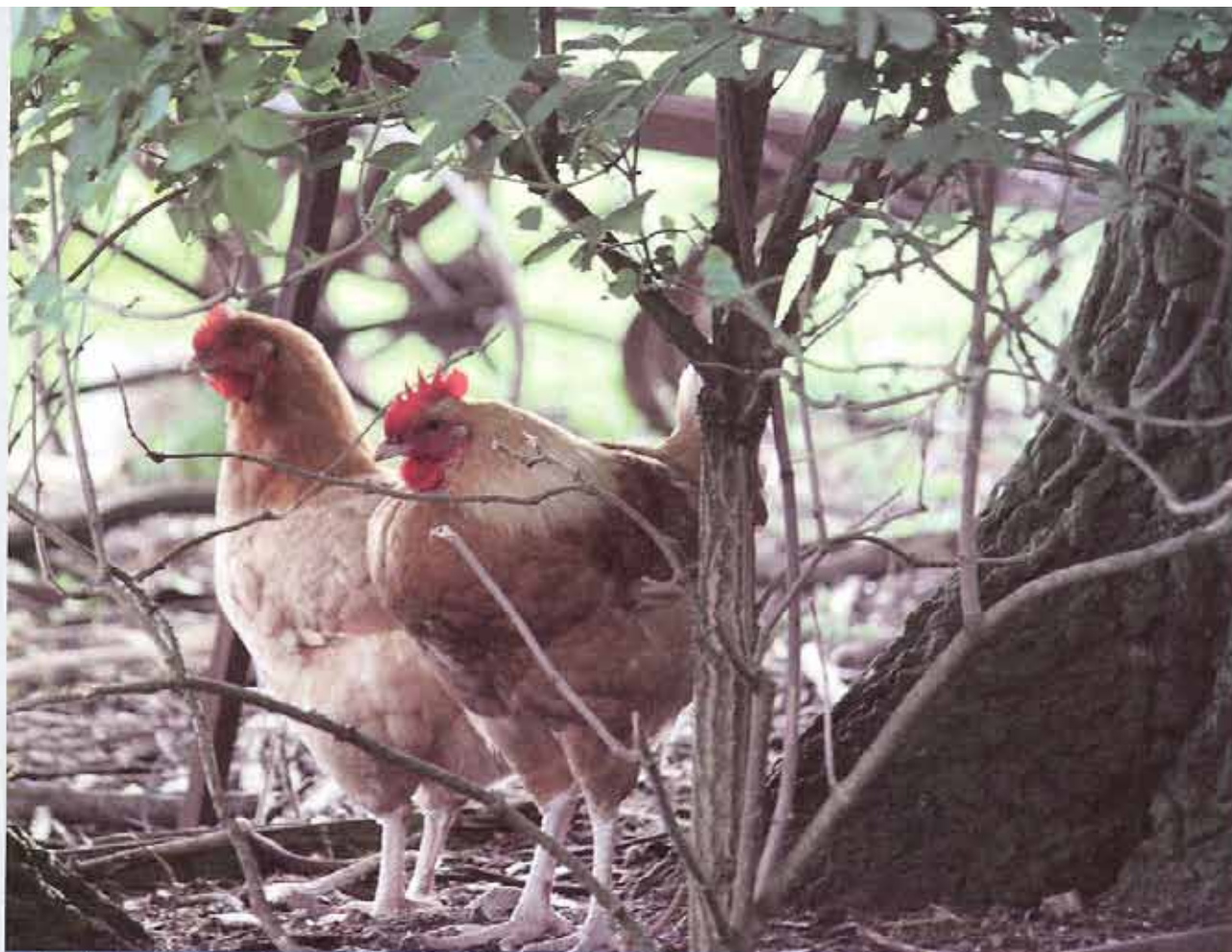
„Husch, husch“ unter'n Hollerbusch: Hühner wollen Deckung vor dem Habicht!

gen Agrarfabriken in der Hühnermast eine ähnliche überregionale Symbolkraft zu wie der BI Haßleben gegen die industrielle Sauenhaltung und Schweinemast. PROVIEH will mit seiner Kampagnenarbeit diesen Widerstand unterstützen.