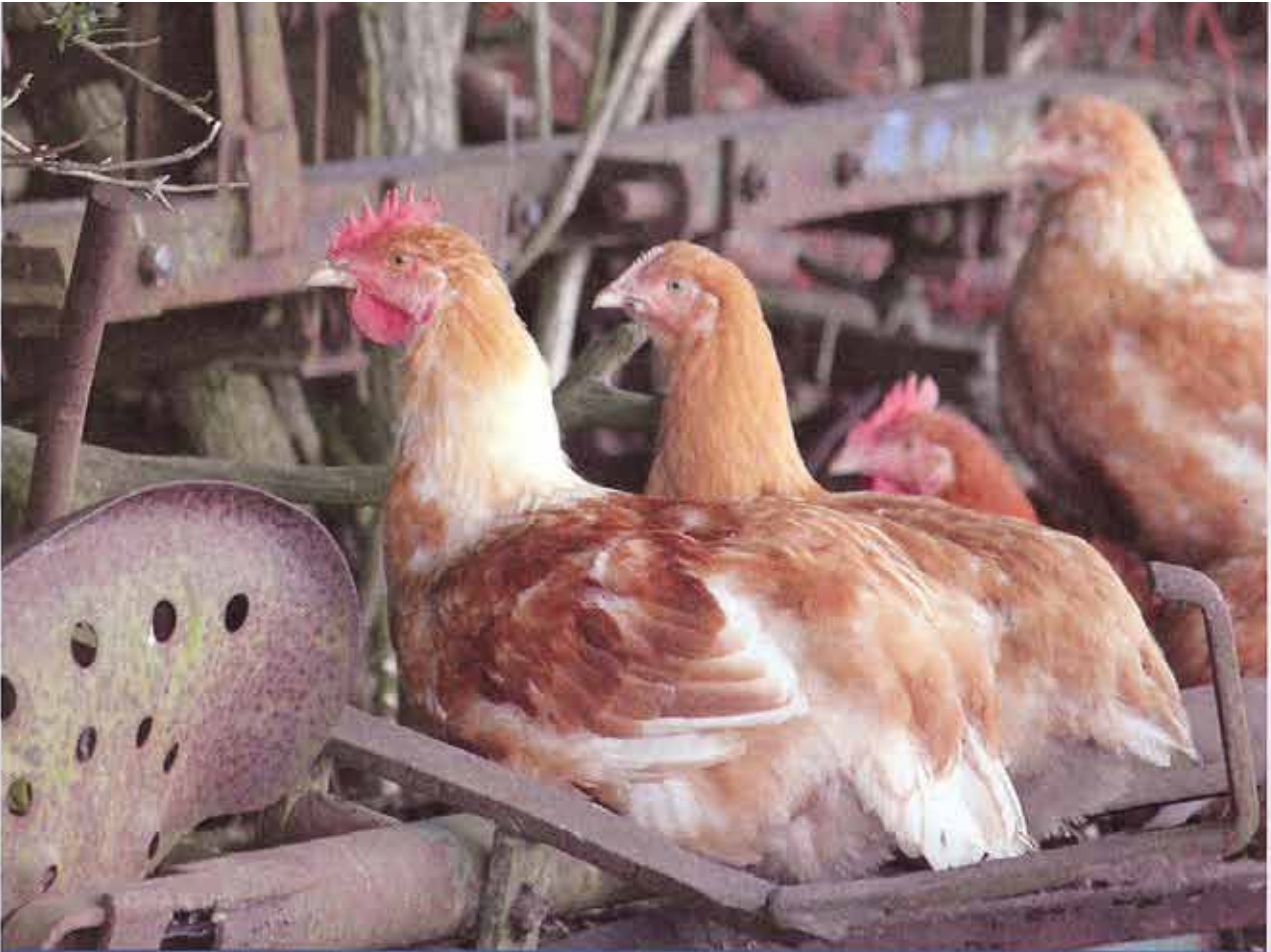
Langsam wachsende Hühnerrassen gehören noch längst nicht zum „alten Eisen“

und zu fressen. Wenn Menschen für ein gutes Leben Hühner nutzen wollen, dann müssen sie diesen Tieren auch ein glückliches, artgemäßes Leben bieten.