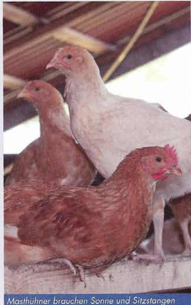
Masthühner brauchen Sonne und Sitzstangen